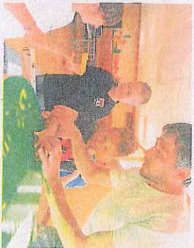
Die Kinder nahmen mit Begeisterung an dem Projekt zur Renovierung teil.