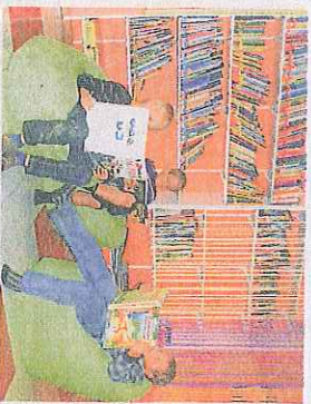
In der Bibliothek können die Kinder gemütlich spannende Bücher lesen.

Nachdem in nächster Zeit nicht mit einem Schulneubau zu rechnen ist, wurde das alte Gebäude saniert.