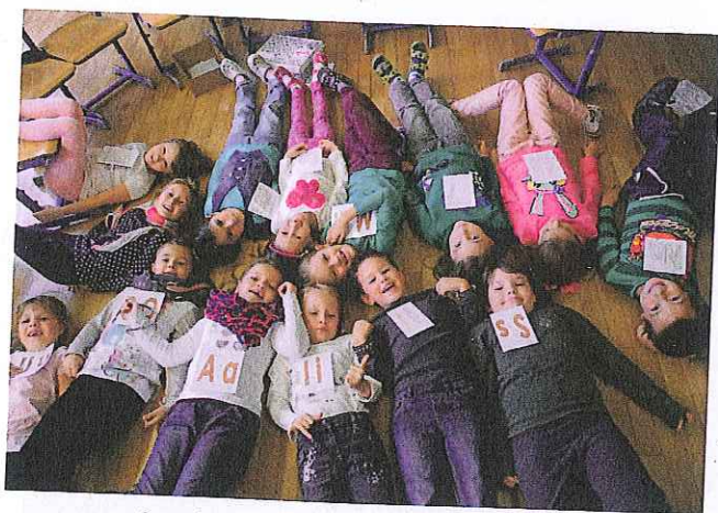
So viele Buchstaben haben wir schon gelernt!