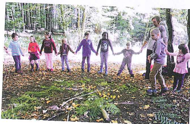
In der Natur fühlen wir uns richtig wohl!