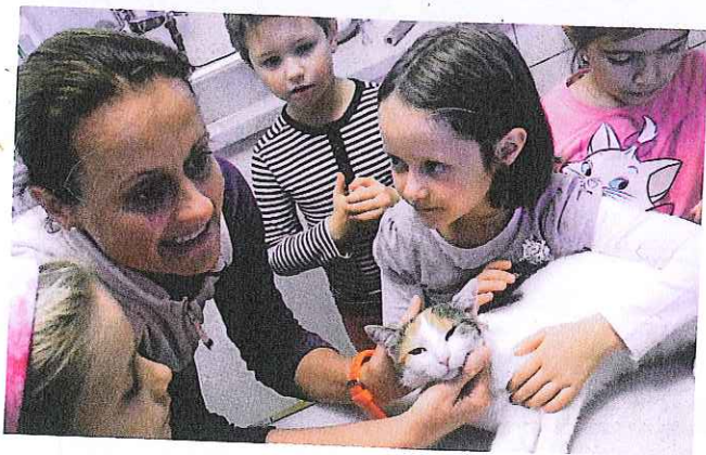
Was wir bei unserer Tierärztin alles lernen können!