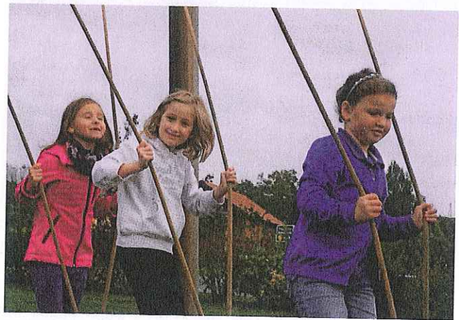
So geschickt sind wir!

setzen wir in unserer Schule auch noch auf einen dritten Schwerpunkt: Die Natur. So wurden unlängst im Garten zwei Hochbeete angelegt, ein Kartoffelacker folgt im Frühjahr. Wir werden gemeinsam mit den Kindern Gemüse und andere Feldfrüchte anbauen, pflegen, ernten, in der Schulküche verkochen und auch verspeisen. Für den Werkunterricht sind Fledermauskästen und Nistkästen für Vögel geplant, die im Garten angebracht, gewartet und beobachtet werden sollen.