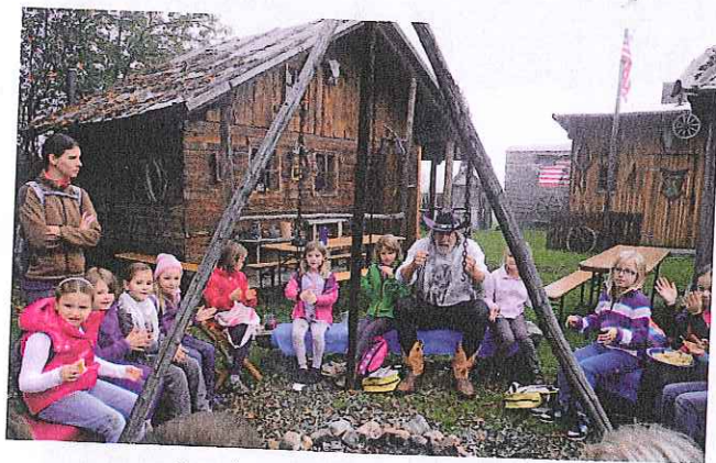
Lagerfeuer bei der Sweetwater Ranch!