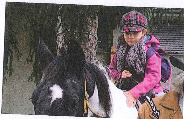
Auch Reiten will gelernt sein!